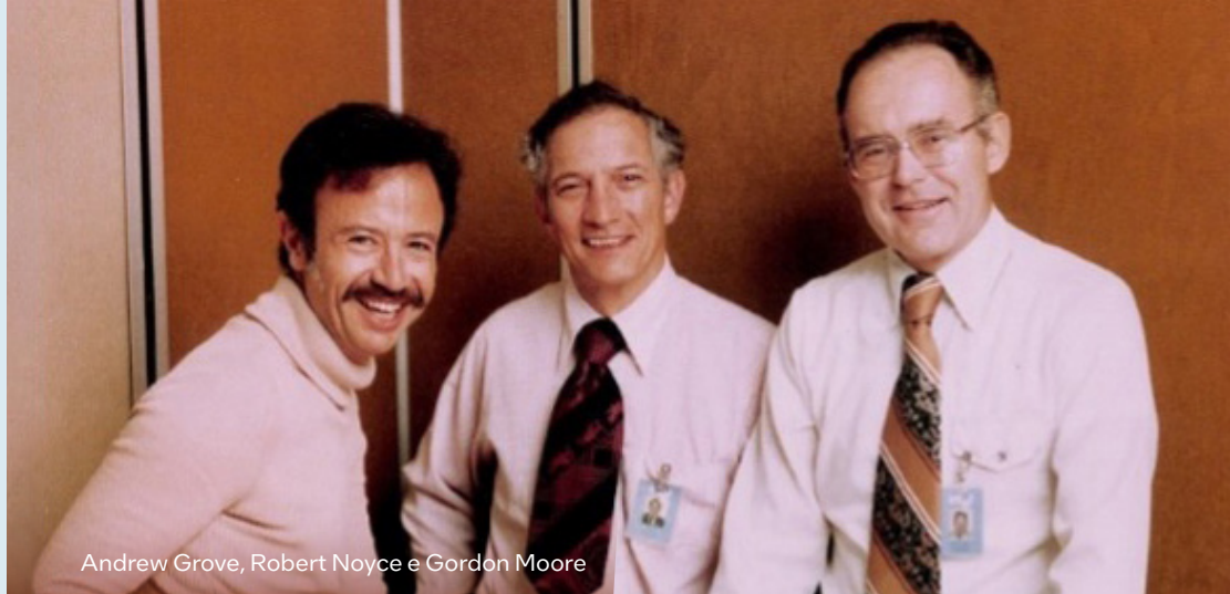
Andrew Grove, Robert Noyce e Gordon Moore